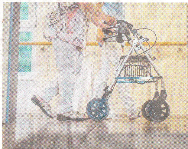
In Alten- und Pflegeheimen sollen die verpflichtenden Tests ausgeweitet werden.

Auffrischungen: Impfverstärkungen („Booster“) rü-