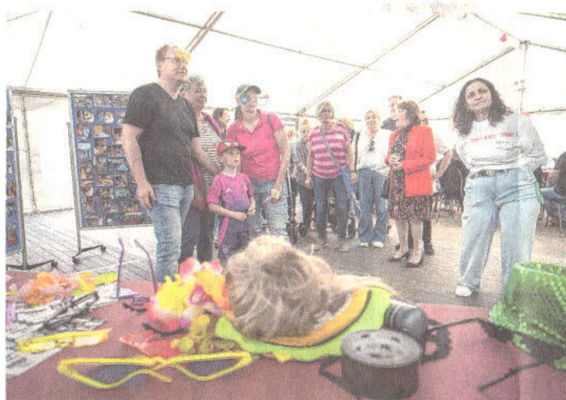
Mit vielen Fotos und buntem Programm wurde in Erinnerungen geschwelgt.